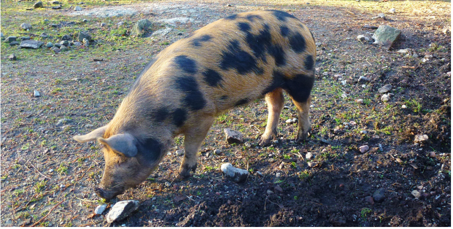
Linderödssvin, den enda svenska lantrasen som har överlevt till våra dagar.