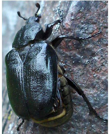
Läderbagge (Osmoderma eremita).

En artikelserie i Ekbladet som jag anser är mycket angelägen och viktig är Stellan Sunhede's med vetenskaplig grundlighet beskrivna eksvampar. Några patologiska vedsvampar kan t.o.m. decimera volymen