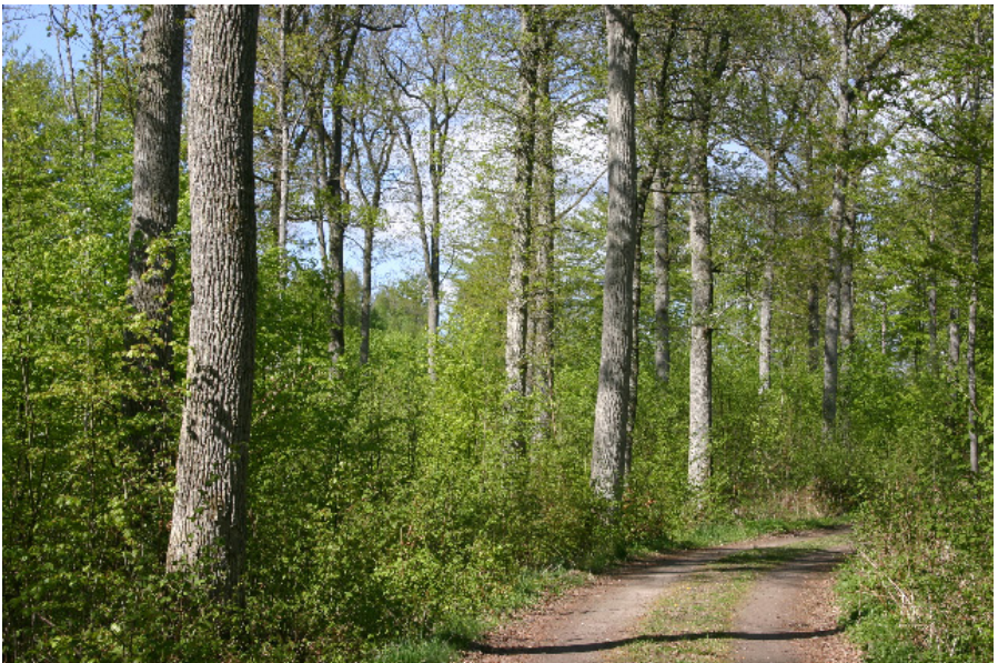
Ekar av mycket hög kvalitet på Vanås gods, Skåne (2006).

Flera av de större godsen i bl.a. Skåne är företagsmedlemmar i Ekfrämjandet. Slot-