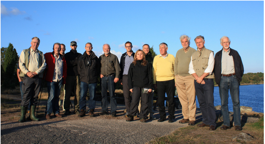
Styrgruppen för Ädellövprogrammet, ett forskningsprogram med bas vid SLU, vid avslutnings-exkursionen i Blekinge 2009. Många Ekfrämjare bidrog med både forskning och som ledamöter i styrgruppen.