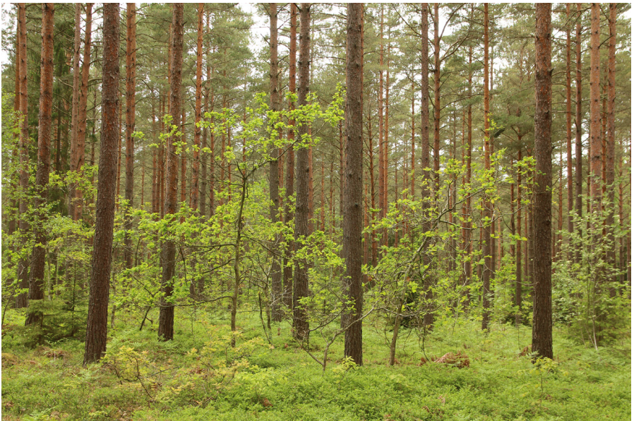
Figur 1. Spontanför yngnad ek i en tallskog kan utgöra basen till ett ekskogsbruk i blandskog. Här kan nog för yngningen skyllas på nötskrikan. Värnsnäs, Kalmar.

Ollonförekomsten kring enskilda ekar påverkas mycket av fåglar och däggdjur. Gnagare kan äta upp frön men dessutom sprida ollon upp till 30 meter i beståndet.