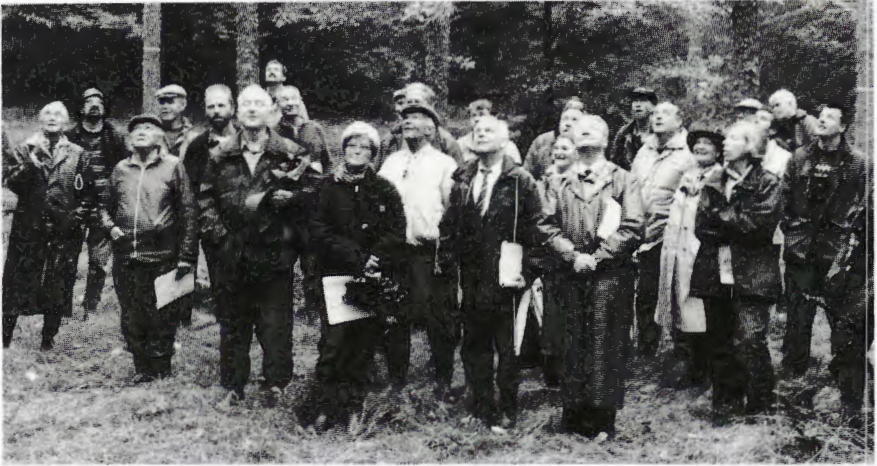
Figur 4. De församlade ädellöventusiasterna beundrar med andakt det höga krontaket i Trolle Ljungbys skogar.