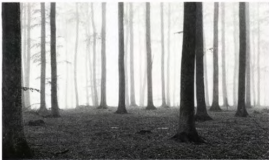
Fig. 1. " .... I det sällsamma ljus som uppstod i regndiset, såg vi hur bokskogen följde sitt eget ekosystems lagar ..." - Ekologiska institutionens (Lunds universitet) försöksyta på Oran.

Efter att AB Gustaf Kähr bjudit på en kopp gott varmt kaffe fortsatte färden genom Orans bokskogar. I det sällsamma ljus som uppstod i regndiset såg vi hur bokskogen följde sitt eget ekosystems lagar och snabbt föryngrade sig på den bördiga nordsluttningen. De små bokplantorna får sedan hjälp på traven av erfarna skogsmän på förvaltningen.