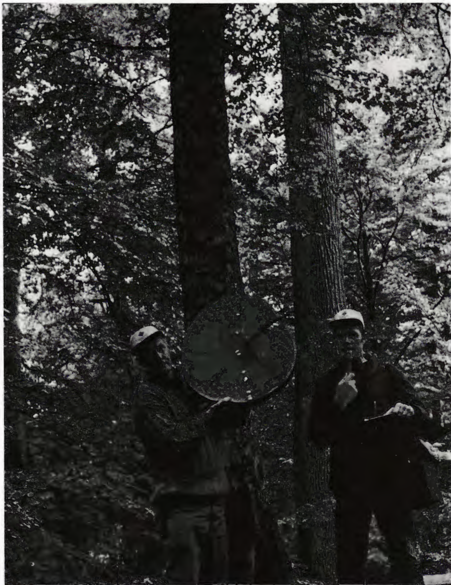
Fig 4. De ståtliga karolinerekarna i Bjurkärrs-reservatet demonstreras av reservatsförvaltaren Jan Karlsson assisterad av konsulent Gert Håkansson. Några data: ålder 260 år, höjd ca 30 m, omkrets 2-3 m, volym m 3 sk 7-9.