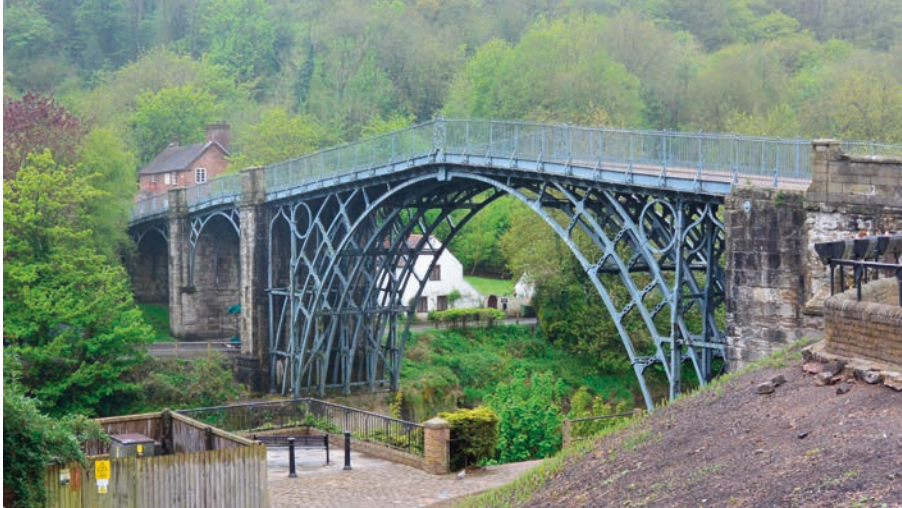
Bron över flodern Severn, världens första i gjutjärn.

fot och 3 tum och väger 847 800 engelska pund (30,63 m och 384,6 ton om nu någon vill mäta på detta fäniga sätt) och byggtekniken med järn var i stort sett densamma som för trä – man visste helt enkelt inte hur järnet kunde användas.