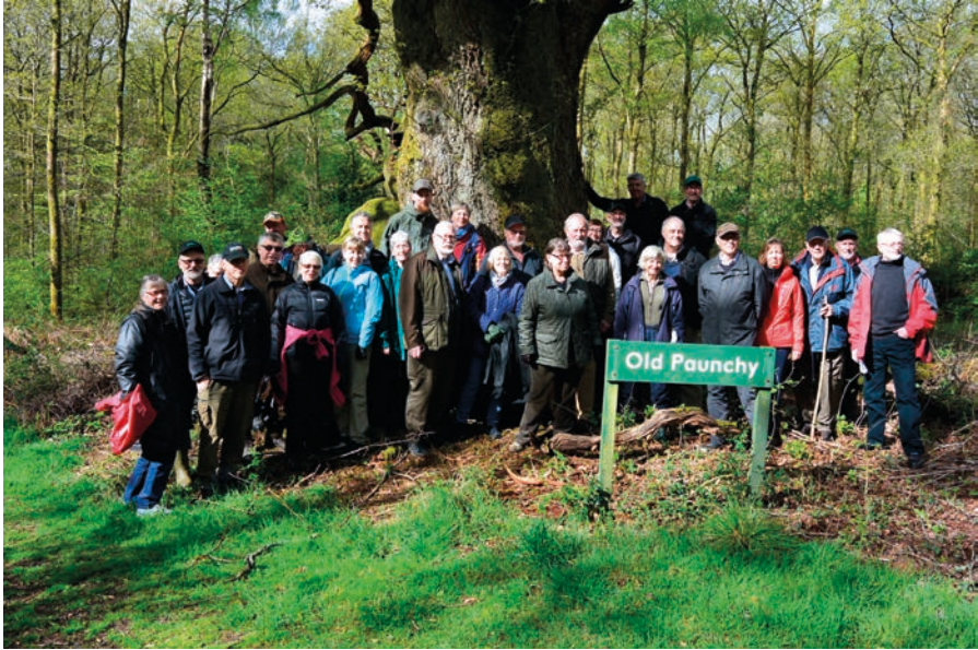
Ekfrämjandet poserar framför Old Paunchy, en av flera grova ekar i Savernake forest.