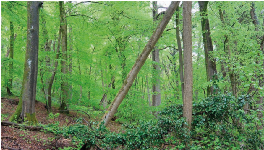
Slump, klimat och vilt hjälper till att skapa skogarna om inte människan hjälper till.

Att åka längs the Grand Avenue omgiven av åldriga ekar och bokar förbi den stjärnformade korsningen Eight Walks ner till the Column som den förste Earlen av Aylesbury, sir Thomas Bruce, reste till minne av George den tredje tillfrisknande ger en känsla av det överdåd, på gränsen