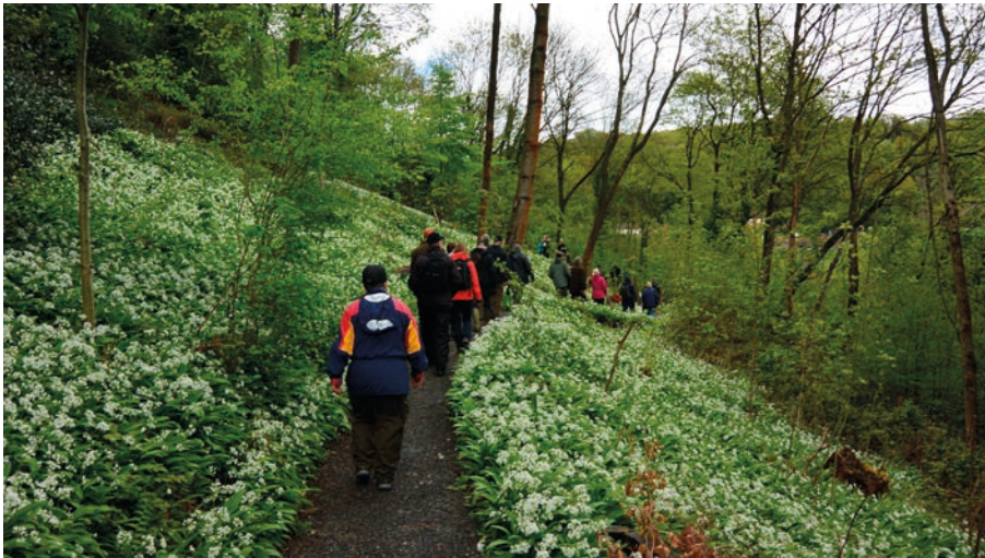
Blommande ramslök kantade vandringen med The Severn Gorge Countryside Trust.

Efter en fantastisk vandring i natur- skogsartade bestånd i floddalen där vatten- ståndet kan variera flera meter i samband med regn passerades naturbetesmarker och parkartade skogar med bland annat stora exemplar av Western Hemlock ( Tsuga he- terophylla ). Vid en gigantisk lind går vi så in vad som var det gamla hjorthägnat och