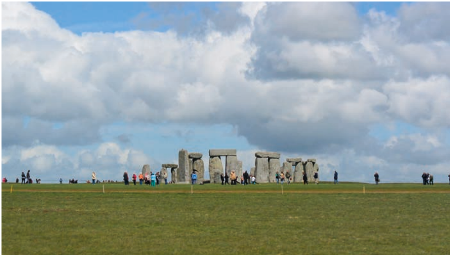
Det imponerande Stonehenge kunde bara betraktas genom bussfönstret, programmet tillät inget stopp.

På väg till Lyndhurst, där vi skulle bo två nätter, passerar vi Stonehenge utan att stanna. Vi får dock en god bild av stencirkeln från vägen. I området finns fullt av andra fornminnen och man får nästan en känsla av uråldriga druider som smyger runt bland bautastenar och gravhögar under dimmiga nätter. I Lyndhurst tog vi in för 2 nätter i det eleganta hotellet Crown Manor där vi blev ompysslade och välgödda med en buffémiddag.