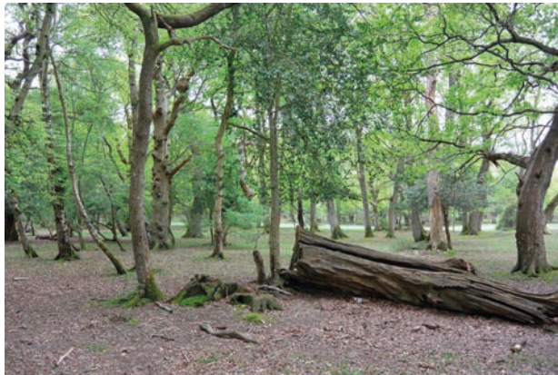
Hårt betad skog och död ved i New Forest.