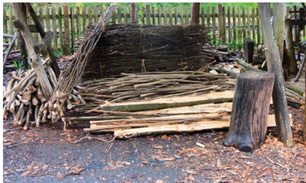
Käppar och bönstörar ger inkomster till småskogsägarna.

En hasselkäpp med 5 cm diameter och två meters längd betingar ett pris på ett pund hos konsumenten och ett knippe ris att använda som bönstörar var hel-