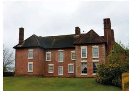
Telford Golf and Leisure hotel, första övernattningen.

fick vi vår första inblick i industrialismens England vid ett kort stopp vid Ironbridge över floden Severn. Abraham Darby I-III förbättrade masugnarna och övergick från träkol till koks under 1700-talet vilket förmodligen räddade de få kvarvarande skogarna. 1779 stod världens första järnbro (av gjutjärn) färdig och industrialismens era hade börjat. Bron har ett spann på 100