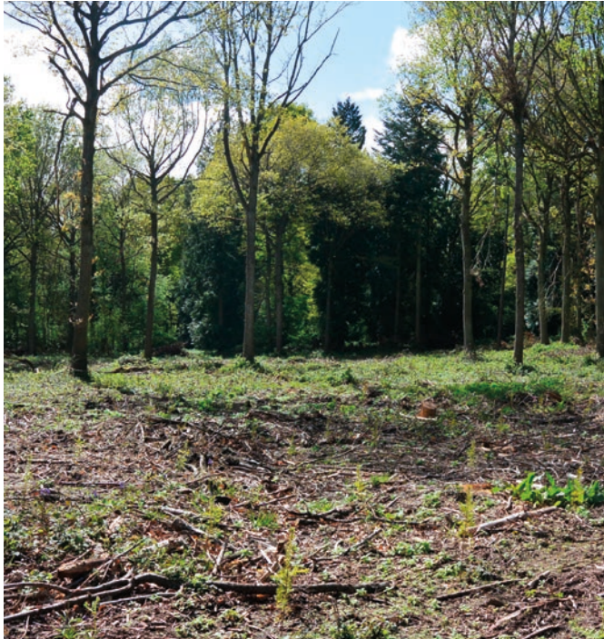
Douglasgran planteras under de gamla ekarna på Garnson's Estate.

Vi får se en slutavverkning av bergsek ( Quercus petraea ) och som vanligt uppstår en våldsam diskussion kring virkesvärde och aptering. Eken är minst 50 % dyrare