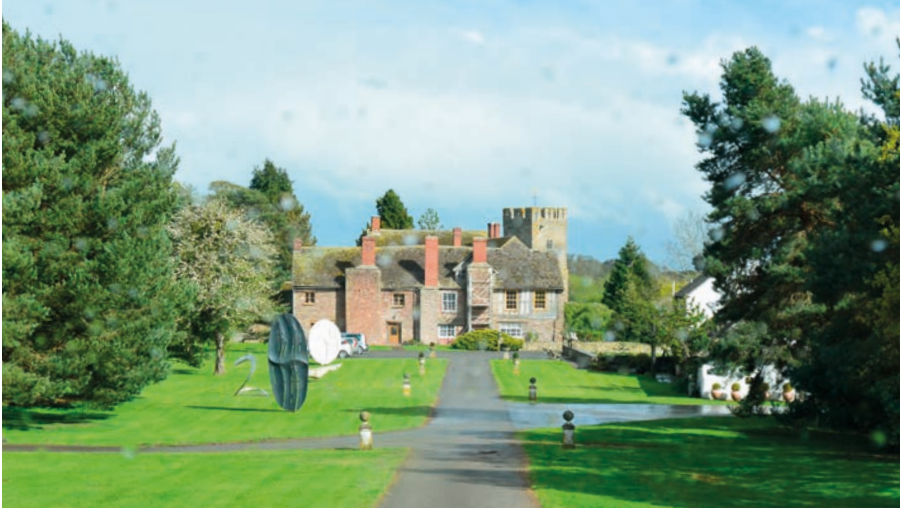
Ett gods som ligger granne med av Prins Charles många egendomar, "The Duchy of Cornwall, Hereford and Cradley Estate woodlands."

än i Sverige och kvaliteten var måttfull. Importen börjar pressa de små engelska sågverken, som är helt inriktade på den inhemska marknaden, och en omfattande sågverksdöd liknande den för svenska bok-sågverk har skett.